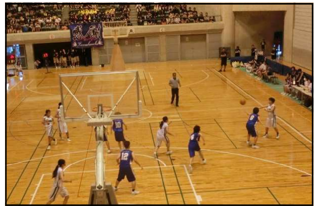
↑ 女バス：農林高校初のベスト8!

部活動を通して、学習意欲が向上したり、基本的 生活習慣が身に付いたり、協調性や社会性が身に付いたり、部活動の教育的効果は大きい。