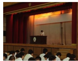
全体集会での事後報告会