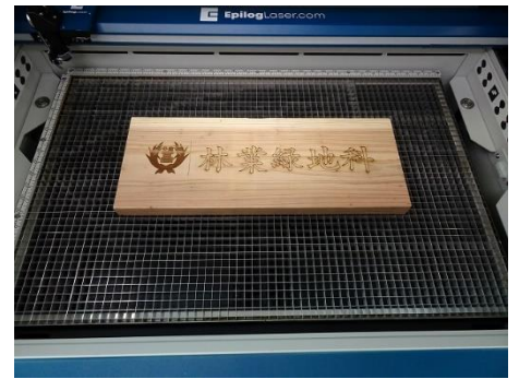
②レーザー加工への挑戦