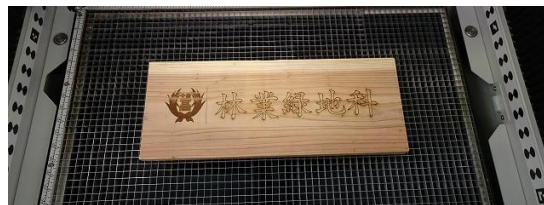
③いろいろな素材への挑戦（杉材、アクリル、竹（2種類））