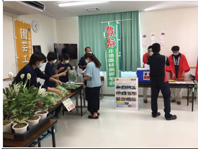
園芸工学科も参加しました