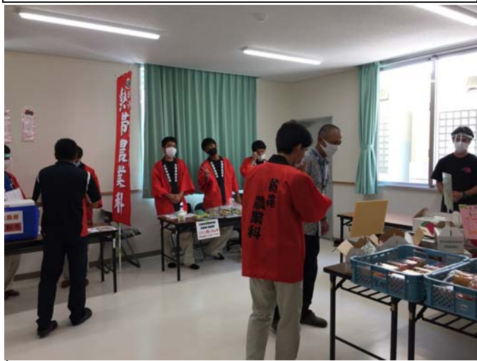
今回は屋内での実施でした