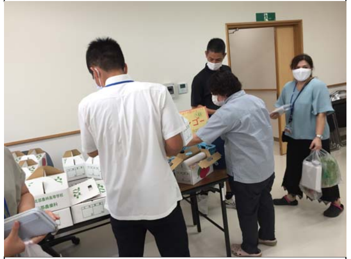
格安マンゴーが一番人気