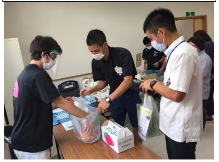
たくさんの購入ありがとうございます