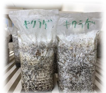
23℃で培養! 白いのが菌系です。順調に生育していますね