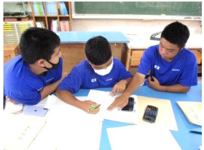
みんなで教え合い