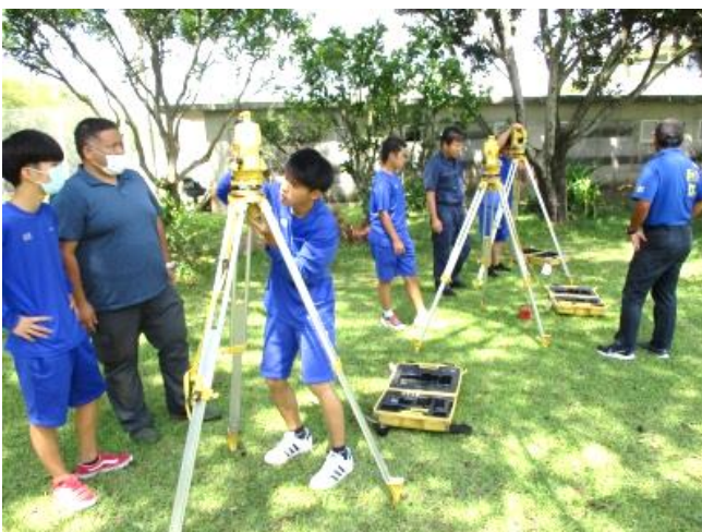
測量の機械を設置