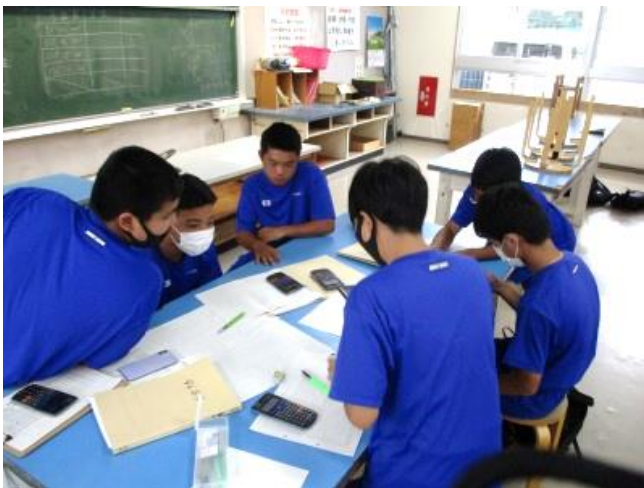
関数電卓を使って計算

情報とは 、地図に含まれる情報には、点の相互位置関係や 距離 ・ 高さ ・ 座標値 ・ 面積 ・ 体積 などがある。