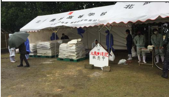
1年男子は屋外で堆肥販売の担当