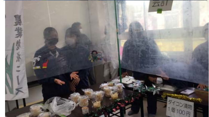
女子は自作のダイコンの漬物を販売