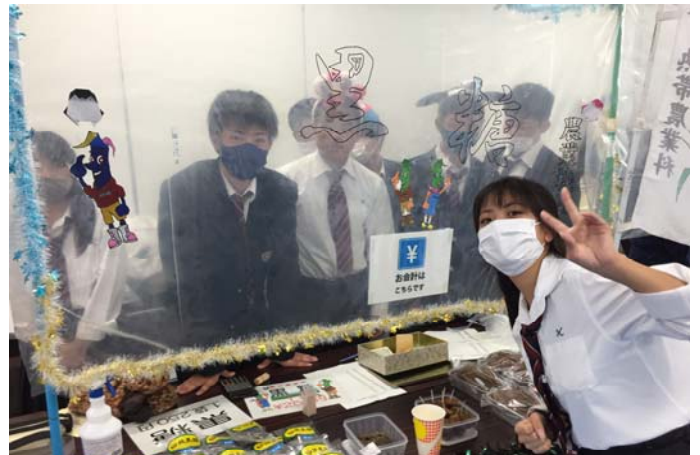
機械コース2年は黒糖とアガラー