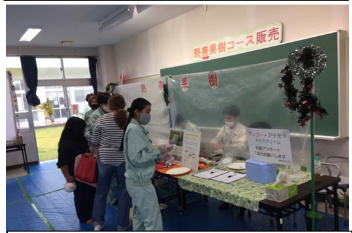
フルーツアイスや苗木も販売しました