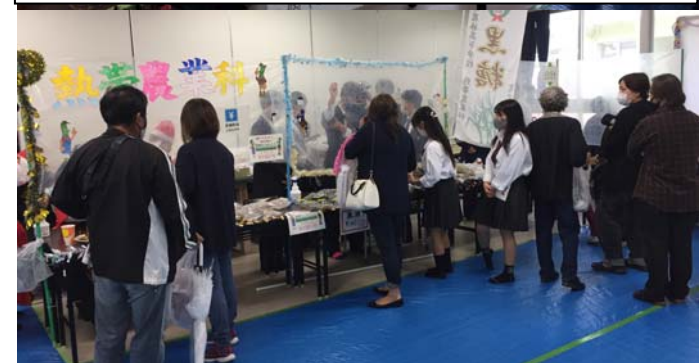
もちろん当日も大賑わいです。感謝！