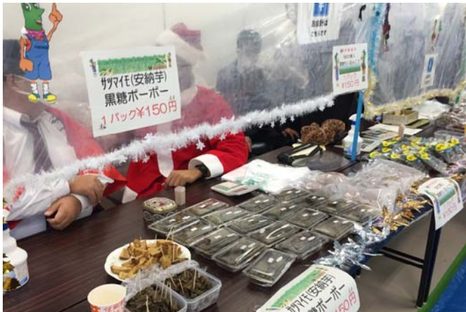
機械コース3年は黒糖加工品販売