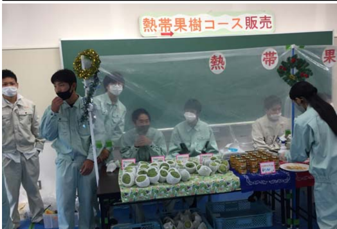
果樹コースはジャム、アテモヤ販売